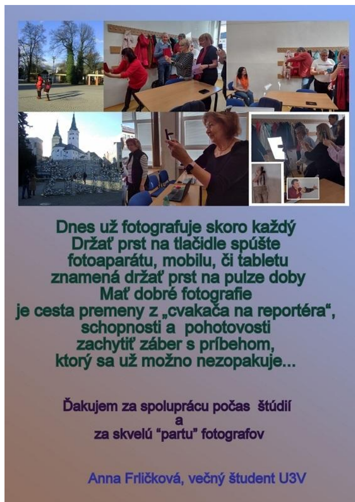
zo záverečnej ročníkovej práce