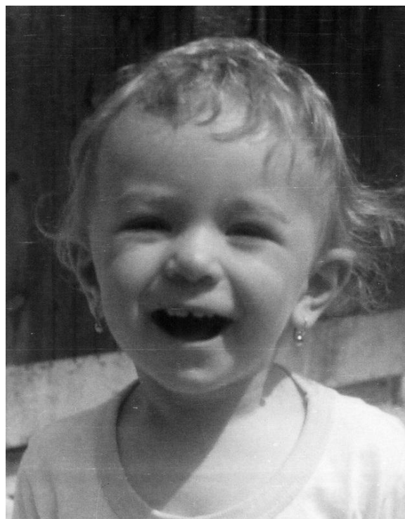
vždy s úsmevom