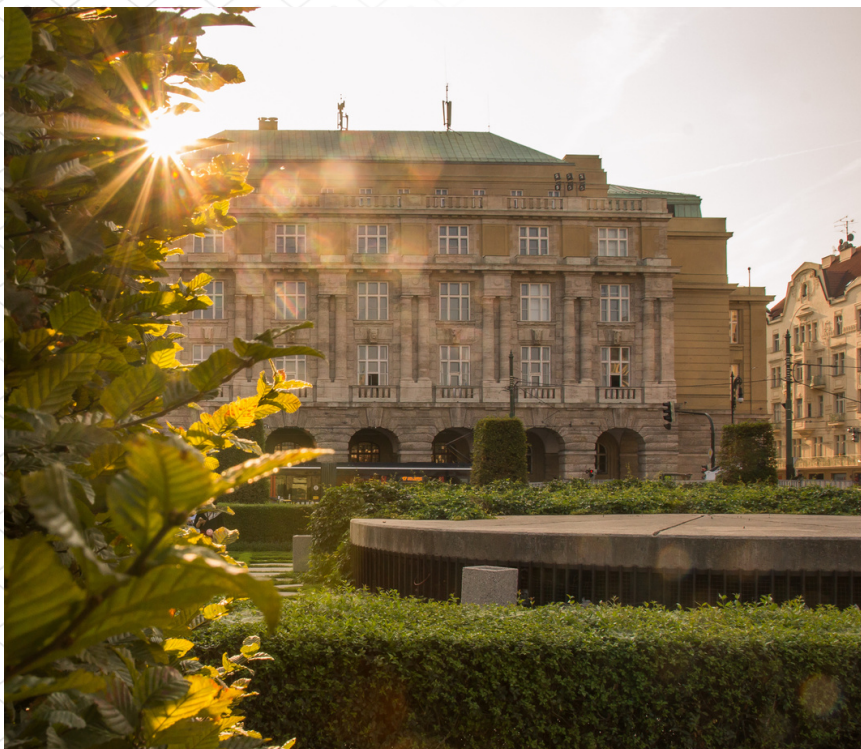
hl. budova FF UK