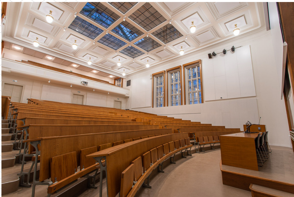
aula (místnost P131)

největší kapacita ze všech prostor Filozofické fakulty, stupňovité uspořádání zajišťuje výbornou viditelnost pro všechny