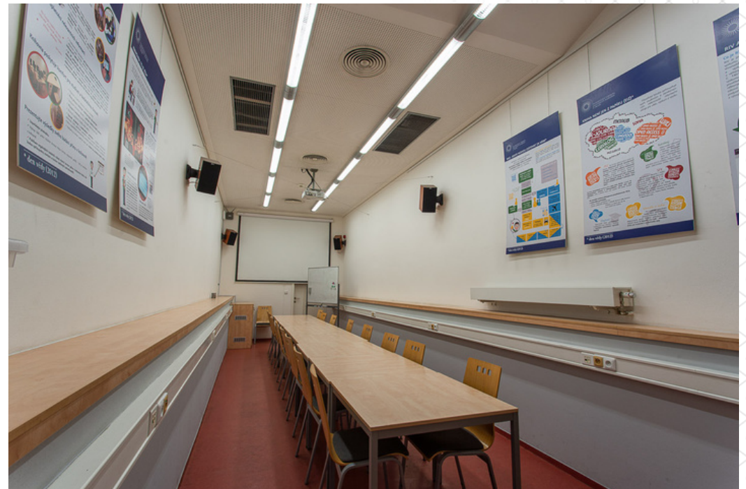
Teamwork Study Room

slightly tiered seating ensuring good visibility, a beautiful view of the Prague Castle