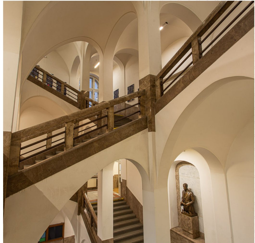
Common areas of the main building of CU FA