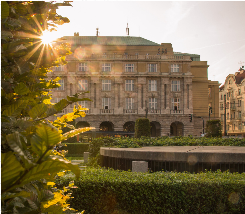
The main building of CU FA