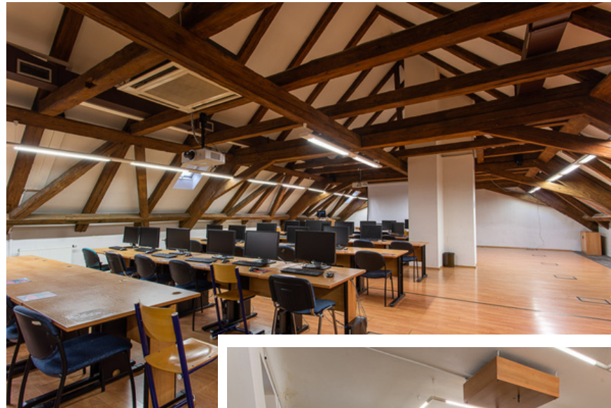
podkroví, seminární místnosti

V blízkém okolí budovy se nachází velké množství stravovacích zařízení nejrozličnějších typů a cenových úrovní.