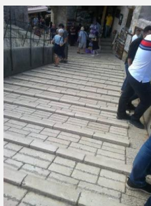
Chůze po mostě je náročná

Možná se zdá, že je článek trochu smutný v předvánočním, čase, ale právě v tuto dobu je dobré si uvědomit, jak u nás proběhlo klidné rozdělení naší země. V současné době jsou vztahy mezi Čechy a Slováky dokonce lepší než za společného soužití.