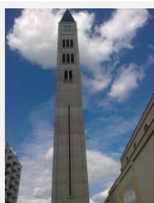
Zvonice je tak vysoká, že se celá do záběru nevešla