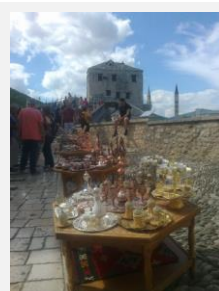
Prodavač suvenýrů na mostě