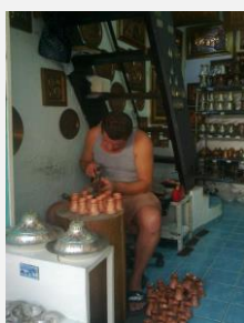
Kovotepec při práci