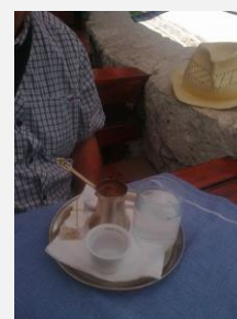
Pravá bosenská káva