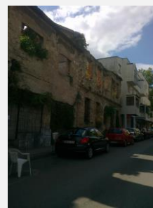
Pozůstatky války. Tento dům není jediný