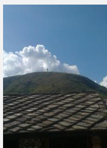
Kříž, který vzbuzuje tolik emocí