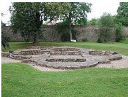
Pozůstatky kostela vysvěceného 1070

Sázavský klášter je rozsáhlý areál bývalého benediktinského kláštera. V 11. století jej založil svatý Prokop a stal se centrem slovanské liturgie. Od konce 11. století zde sídlili mniši latinského ritu, klášter byl nově postaven goticky a přestavěn barokně. Klášter byl zrušen na konci 18. století a přestavěn na zámek.