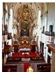
Pravoslavná bohoslužba v interiéru kostela sv. Prokopa