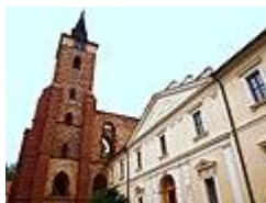
Nedokončený gotický kostel sv. Prokopa