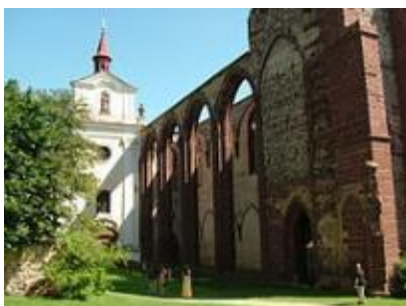
Barokní kostel na místě chóru a nedokončená gotická loď

Klášter byl roku 1951 zestátněn. Správcem areálu se stala Národní kulturní komise. Roku 2013 byl klášter navrácen Římskokatolické farnosti Sázava - Černé boudy a Benediktinskému opatství Panny Marie a sv. Jana Křtitele v pražských Emauzích. Benediktini se ale o část kláštera nezvládají starat, proto se stát na jaře roku 2018 rozhodl jejich podíl odkoupit, aby cennou památku zachránil.