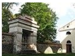
Hrobka Tiegelů z Lindenkronu naproti kostelu sv. Prokopa