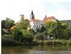
Pohled na klášter přes řeku Sázavu

Jeden kilometr severovýchodně od kláštera se nachází údolí zvané Čertova (Prokopova) brázda. Jeho dolní úsek lemuje jednoduchá a prostá křížová cesta, kterou vybudovali po roce 2000 členové řádu svatého Bazila Velkého. Zastavení tvoří dřevěné kříže s připevněným obrázkem.