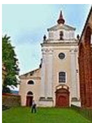
Kostel sv. Prokopa