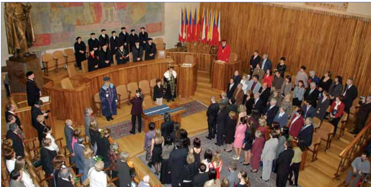
Promoce studentů FF UK