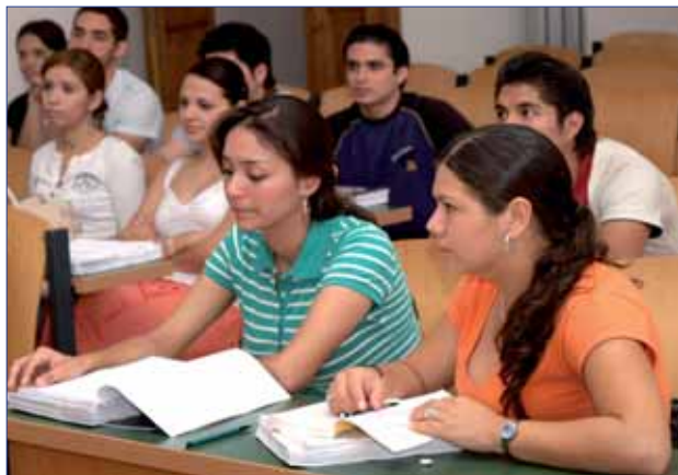
Zahraniční studenti na FF UK

V rámci programu ECES, který se zaměřuje na semestrální kurzy, proběhl i čtyřtýdenní letní intenzivní kurz ECES, kterého se zúčastnilo 42 studentů (převážně z USA).