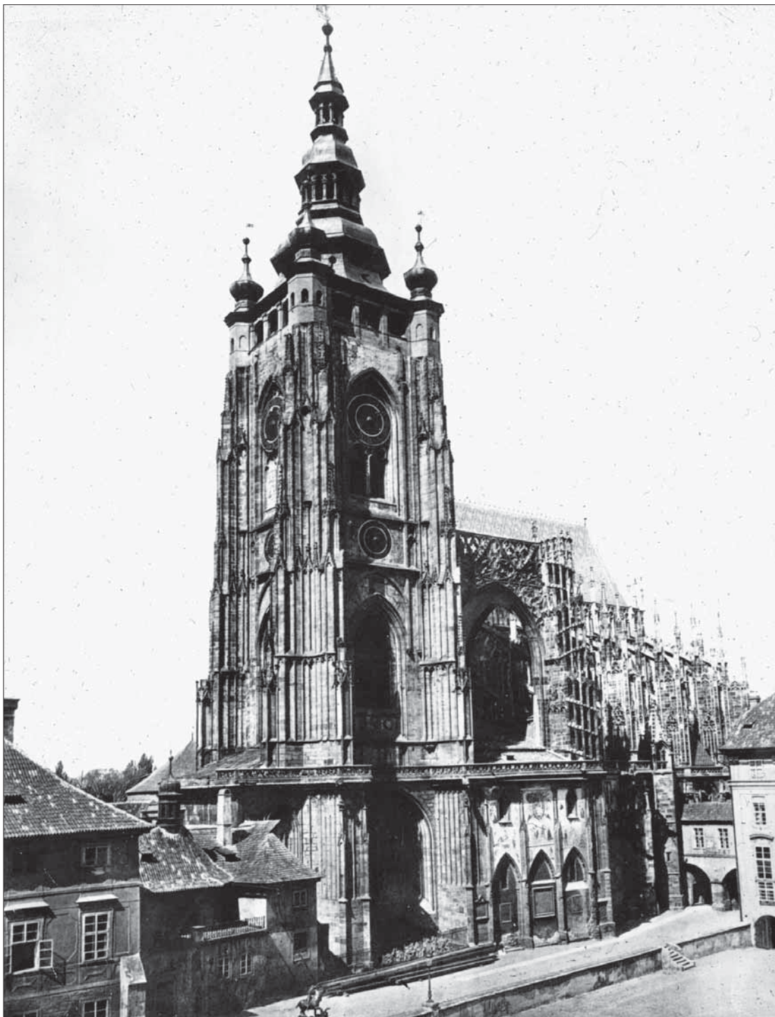
Skleněný diapositiv katedrály sv. Víta na Pražském hradě

cemi (Deutsche Fotothek Dresden; Technische Universität Dresden, Philosophische Fakultät) o napojení tohoto fondu na mezinárodní dokumentační síť. Bohatý fond této sbírky byl využit i pro přípravu kalendáře Univerzity Karlovy pro rok 2007.