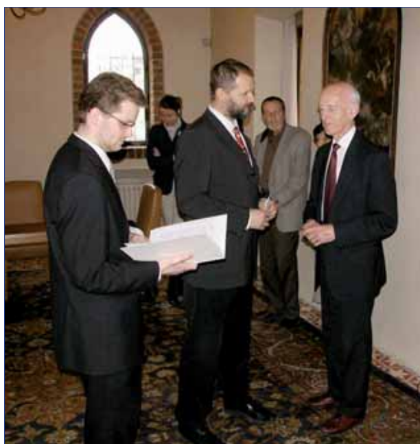
Prof. Wolfgang Iser přebírá Zlatou medaili UK.

V roce 2006 přijala FF UK dva perzekvované studenty z Běloruska, kterým nebylo umožněno v jejich zemi pokračovat ve studiu. Oba studenti nastoupili na začátku akademického roku 2006/2007 ke studiu na FF UK. Pobyt studentů se uskutečňuje s podporou rektorátu Univerzity Karlovy.