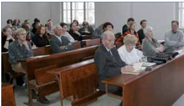
Posluchači kurzu CŽV

4.1 V letním semestru ak. roku 2005/2006 a v zimním semestru ak. roku 2006/2007 se na fakultě konalo 21 kurzů, do nichž se zapsali celkem 473 posluchači. V rámci CŽV je druhým rokem realizováno další vzdělávání učitelů jako transformační a rozvojový projekt a projekt JPD 3. Osvědčil se rektorátní systém pro evidenci kurzů v elektronické podobě, který zprůhlednil aktivity konající se v rámci CŽV a kompatibilitu databáze se zmíněným rektorátním evidenčním systémem. Tento systém slouží pro tištěné výstupy a další účely.