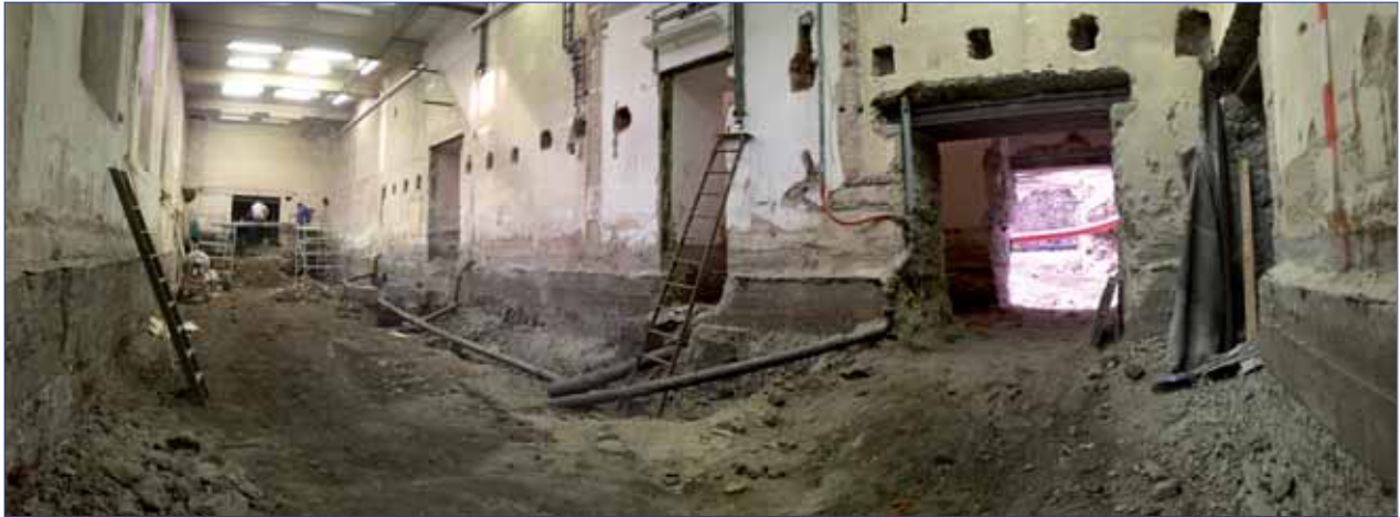
Druhý suterén v průběhu stavby

tovitele díla. Zahájení výstavby s vybraným zhotovitelem I. ČESKÁ STAVEBNÍ PRAHA, s. r. o., se opozdilo proti původnímu předpokladu (září 2006) o dva měsíce zejména pro schvalování dodatku k investičnímu záměru z důvodu navýšení objemu prostředků na realizaci akce z 42 mil. Kč na 47,3 mil. Kč. Toto zpoždění znemožnilo využít pro hlučné bourací a zemní práce klidné období letních prázdnin. Další průběh akce z hlediska časového a finančního byl ovlivněn zejména záchraným archeologickým výzkumem, který na stavbě provádí Muzeum hlavního města Prahy, dále pak nepředvídatelným stavem nosných konstrukcí po obvodu budovy v suterénech do nám. J. Palacha. V neposlední řadě nepřispívá k hladkému průběhu akce hledání náhradních skladových a pracovních prostorů zabíraného suterénu, a to zejména pro Ústav Českého národního korpusu. Celkem bylo na realizaci akce v roce 2006 čerpáno 11,1 mil. Kč státní dotace. Z vlastních zdrojů fakulta vynaložila v rámci plánované spoluúčasti prostředky ve výši 0,48 mil. Kč, zejména na zajištění technického dozoru stavby, výběr zhotovitele díla a práce na archeologickém výzkumu.