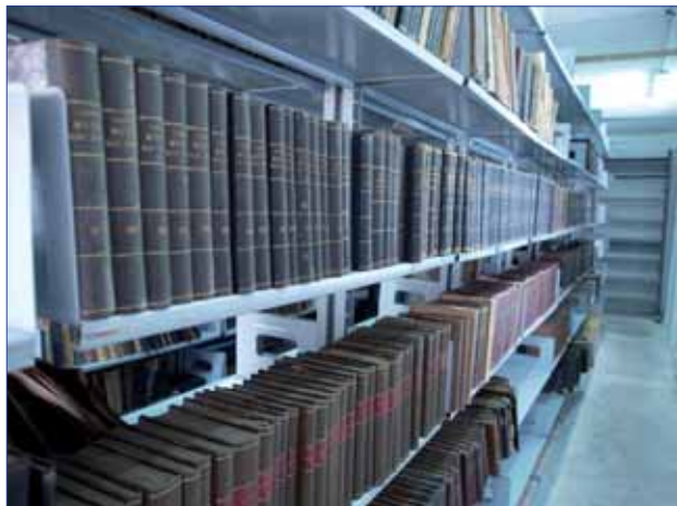
Fondy v depozitáři FF UK v Lešetících

protože pracovníci NK při opakované návštěvě zjistili přítomnost plísňových spór. Během roku 2006 byly tedy zajištěny prostory, do kterých se fond Pekařovy knihovny přesune, a byla vybrána stěhovací firma, která provede nejen vlastní stěhování, ale i kvalifikovanou mechanickou očistu knižních svazků. Otevření tohoto vzácného fondu veřejnosti se předpokládá během roku 2007.