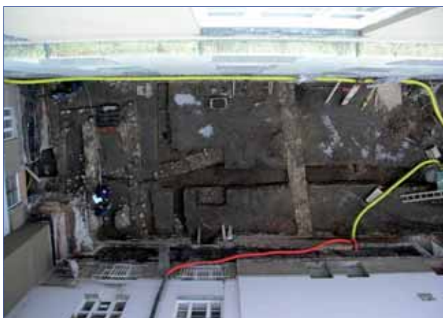
Celkový pohled na dvůr při archeologickém průzkumu

V oblasti rozvojové stála na prvním místě realizace druhé etapy výstavby centrální knihovny. Po schválení zadávací dokumentace na provedení stavby a obchodních podmínek bylo v dubnu 2006 ve spolupráci s externím organizátorem spol. EUROTENDER, s. r. o., zahájeno řízení na výběr zho-