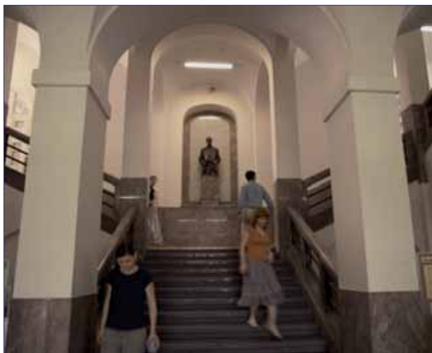
Schodiště v hlavní budově Filozofické fakulty UK

formě studia. Samotné vyplácení účelových stipendií bylo z důvodu chybějících prostředků pozastaveno. Vydání opatření vedlo k radikálnímu snížení počtu studentů 4. ročníků prezenčního doktorského studia na tři.