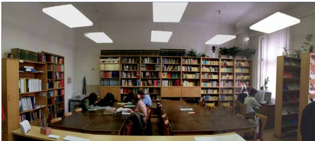
Studovna knihovny germanistiky

Knihovní fond fakulty dosáhl celkově 1 053 082 jednotek. Z rozpočtu na literaturu v celkové výši 2 400 000 Kč bylo na nákup knih čerpáno 981 718 Kč. V rámci centrálního nákupu a distribuce časopisů bylo do knihoven objednáno celkem 527 exemplářů časopisů, z toho nákupem 325 titulů v celkové hodnotě 864 967 Kč, 17 titulů tvořily dary.