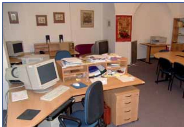
Interiér Šporkova paláce