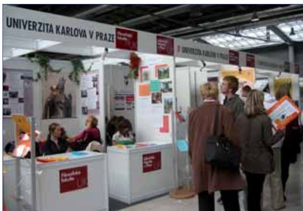
Stánek FF UK na veletrhu pomaturitního vzdělávání Gaudeamus v Brně

FF UK. Do vnitrořadního přijímacího řízení se přihlásilo 332 uchazečů, z nichž bylo přijato 219. Připraveno a schváleno bylo nové opatření děkana č. 2/2007 upravující toto řízení pro akademický rok 2007/2008.