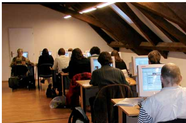
Počítačová učebna ve Šporkově paláci

V prvním čtvrtletí roku 2006 zpracovalo SVI bibliografii veřejně publikovaných prací interních pracovníků FF UK za rok 2005. Sběr dat byl prováděn formou elektronických formulářů. Konečné zpracování bylo provedeno v programu ProCite. Bibliografie obsahovala celkem 1 935 záznamů veřejně publikovaných prací pracovníků fakulty (908 monografií, učebnic, statí ve sbornících a dalších pramenů,