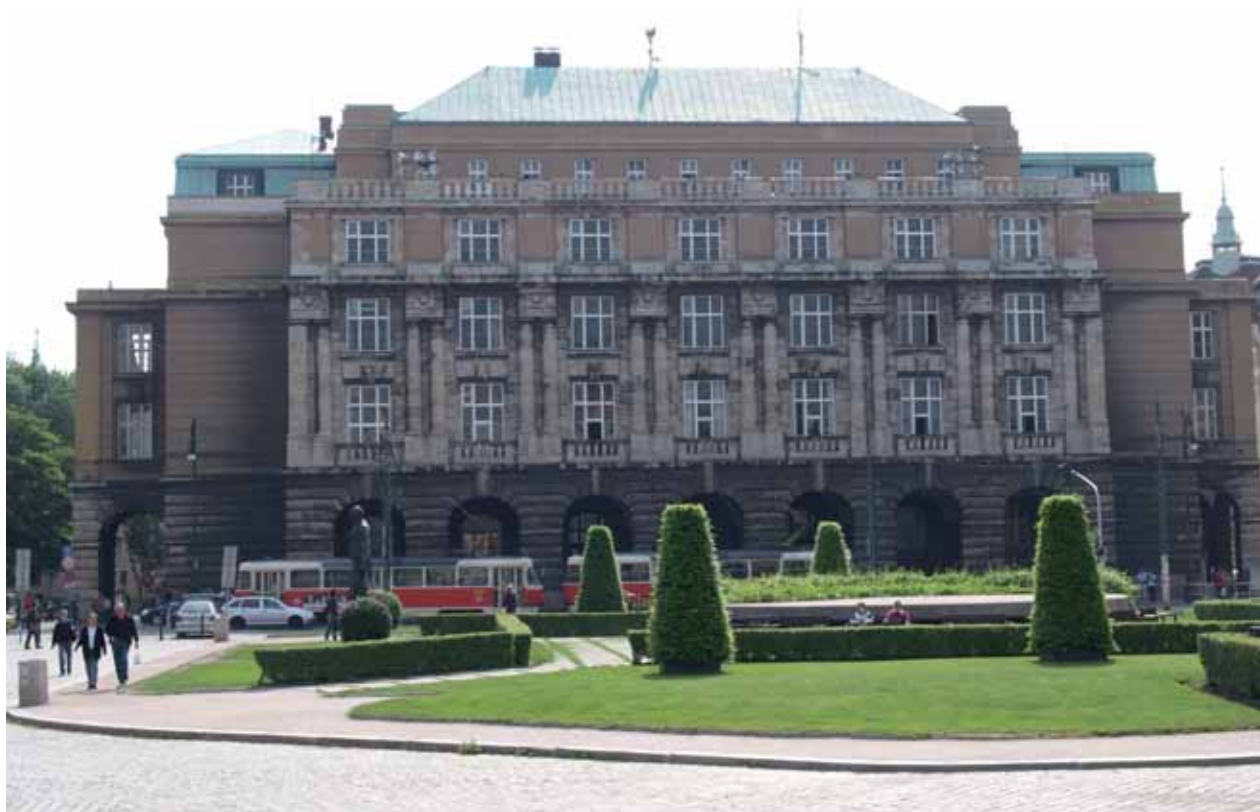
Hlavní budova Filozofické fakulty UK