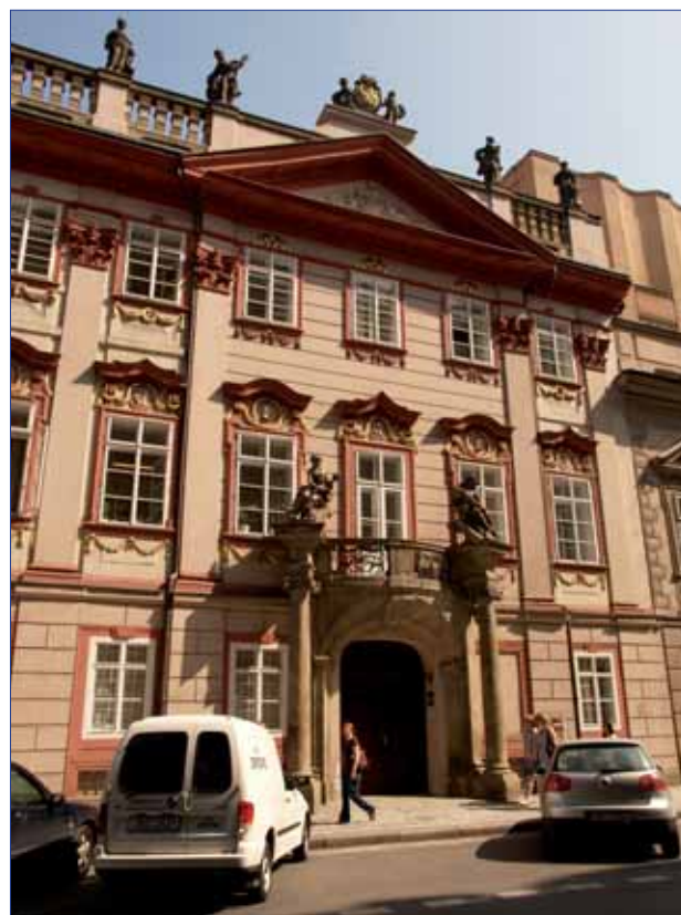
Budova Filozofické fakulty UK v Hybernské ulici – Šporkův palác

4.5 Ve spolupráci s ekonomickým oddělením se podařilo v závěru roku využít finanční prostředky z projektu Podpora infrastruktury U3V zejména k nákupu odborné literatury pro pracoviště, která kurzy U3V zajišťují, a na mimořádné odměny pracovníkům, kteří se na U3V výrazně podíleli. Efektivita výuky je zvýšena využíváním moderní audiovizuální techniky.