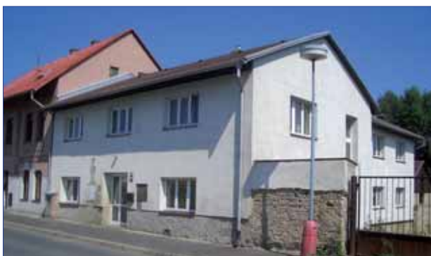
Nový objekt Centra terénního výzkumu v Mělníce

Další akci týkající se reprodukce majetku s účastí státního rozpočtu představovalo dokončení nátěrů části oken hlavní budovy v rámci „UK FF – dílčí rekonstrukce a obnova“, pokračující z roku 2005. Dotace byla čerpána v plném rozsahu převedených prostředků ve výši 2,1 mil. Kč.