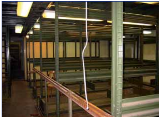
Původní stav 2. suterénu, kde sídlila knihovna rusistiky. Původně tu byla tělocvična.