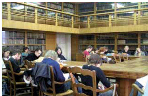
Výuka na FF UK

V oblasti výuky jazyků dosahuje výborných výsledků pracoviště Mediátéka. Ústavem české literatury a literární vědy je budován projekt elektronické knihovny české literatury, který je otevřen také všem zrakově handicapovaným studentům.