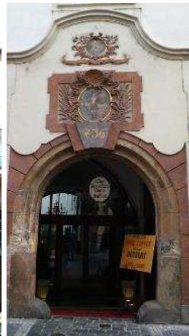
Portál domu U železných vrat

Eva Zbořilová – těším se na další pokračování