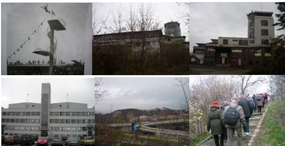
Jarka – fialka

Díky za tuto procházku a všem přeji krásné svátky vánoční