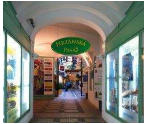
Pohled do Hrzánské pasáže