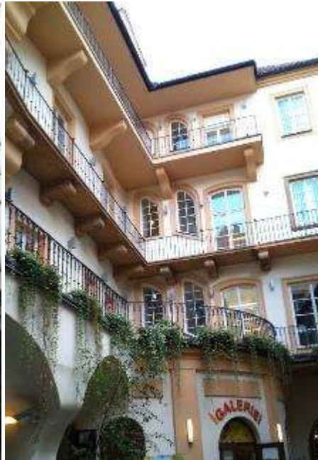
Pasáž Richterova domu