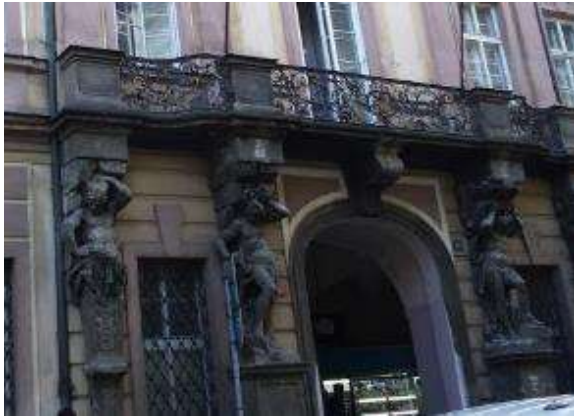
Plastiky Ignáce Platzera na Nové mincovně