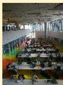
11 - NTK