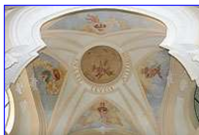
Nástrovní nástěnné malby Andělé nesoucí vladařské insignie a Svatý kříž