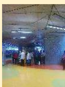
6 - NTK