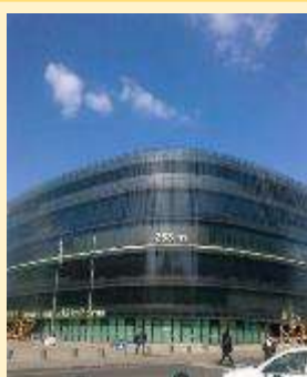
1 - NTK