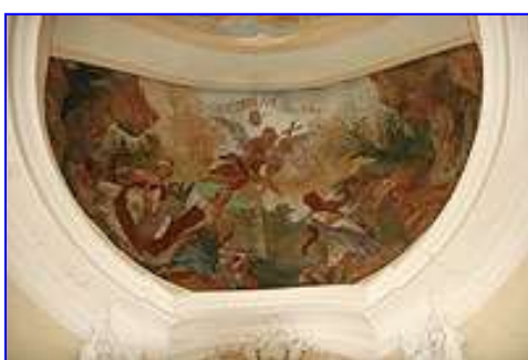
Nástěnná malba nad oltářem Vítězství křesťanství nad pohanstvím