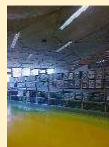
8 - NTK