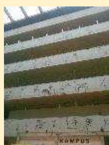
10 - NTK