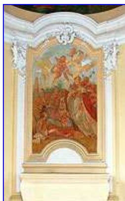
Kamenný oltář a nástěnná oltářní malba nalezení Kristova kříže císařovnou Helenou