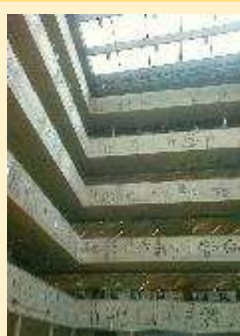
2 - NTK