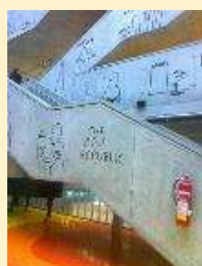
5 - NTK