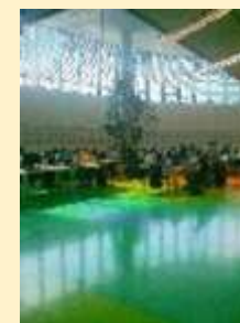
12 - NTK