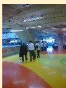
9 - NTK