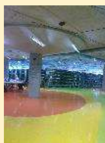
7 - NTK