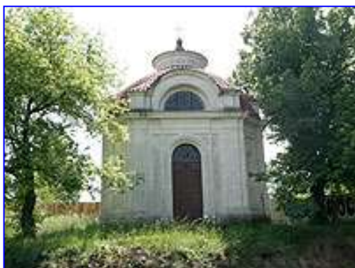
Pohled na kostelík