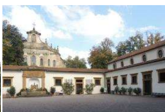
Rychnov na Kněžnou – nádvoří s průčelí kostela

V údolí Orlice je městečko Potštejn , ve kterém najdete zámek a nad ním zříceninu hradu. Oba objekty i městečko jsou rovněž zajímavé a dobře se starají o návštěvníky – najdete dobré služby a také zajímavé programy.