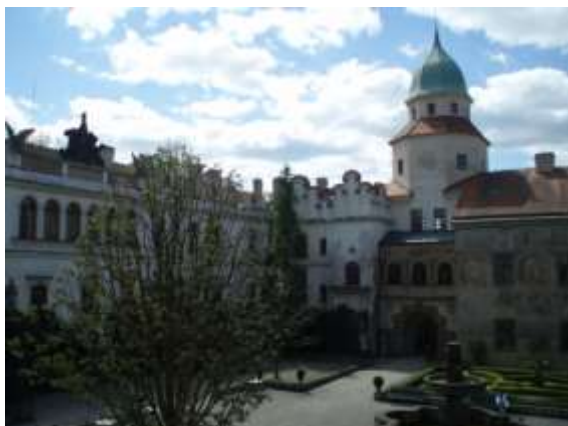
Častolovice – nádvoří