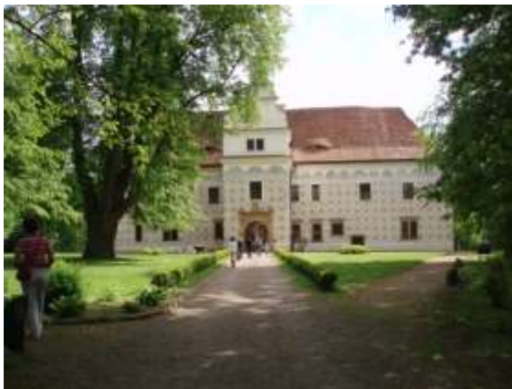
Doudleby – hlavní průčelí

Doudleby byly rovněž v restituci vráceny majitelům - Bubnům z Litic – v interiéru jsou nádherné původní renesanční kožené tapety – chloubou je zrcadlový sál, lovecký salonek a další. Součástí areálu je zámecký park, který navazuje na nově vybudovanou oboru.