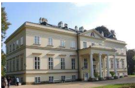
Kostelec nad Orlicí – hlavní průčelí

Rychnov na Kněžnou byl v restituci vrácen rodině Kolovratů. V 18. Století byl pozván Jan Blažej Santini-Eichl a provedl zásadní úpravy, zejména kostela, jak zčásti je vidět na obrázku. Zajímavá je obrazárna, která patří u nás k nejvýznamnějším. Zámek je součástí krásného města, kde se narodil Karel Poláček a také tady najdeme sousoší „Bylo nás 5“. Pod zámkem je velmi zajímavá kolonie malých domků zvaná „chaloupky“ – nenechte si ujít. Z druhého břehu Kněžny je pak krásný pohled na kostel – říkají mu „Rychnovská Hradčana“