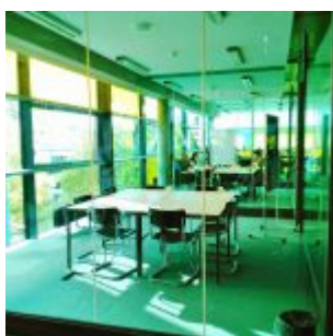
Týmové studovny v právnické knihovně Universität Hamburg