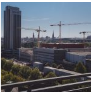
Hamburk – město ve výstavbě: neustálý stavební ruch, bagry a rypadla...