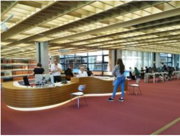
Výpůjční pult Stabi

Po zevrubné přednášce nás čekala exkurze ve značně členitém prostoru zázemí, ale také ve studovnách a volném výběru. Prakticky za provozu prochází knihovna náročnou modernizací, mění se koberce pohlcující kročejový hluk, nábytek, počítačové vybavení atd. Roste rovněž počet studoven a týmových pracoven na úkor knižních regálů. Součástí složitě členěné budovy, která v sobě spojuje hned několik různě starých a architektonicky řešených budov, je také monumentální výstavní a přednáškový sál.