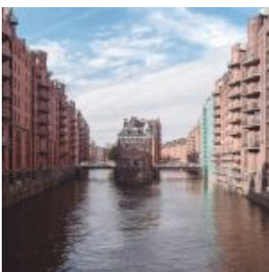
...ale i vysoké hanzovní paláce z červených cihel nad řekou, železné, kamenné i betonové můstky...