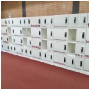
Kdo nemá paměť na čísla skříněk, tak si snad snáz vzpomene, že si bundu zamkl v Drákulovi nebo v Emmě Bovaryové (skřínky v hamburské Stabi)