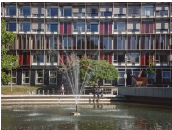
Universität Hamburg – kampus

Druhý den po ubytování nás očekávaly hned dvě knihovny – Zentralbibliothek Recht der Universität Hamburg a Staats- und Universitätsbibliothek Hamburg.