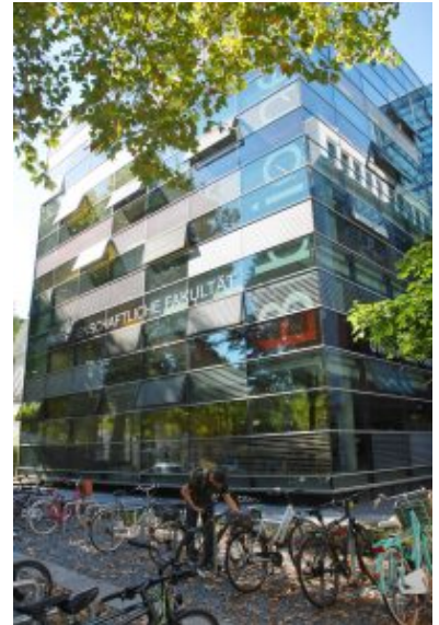
Skleněný palác právnícké knihovny

Studenti knihovnu využívají prakticky po celý den až do hluboké noci, kdy odborný personál předává vládu nad budovou ochrance. Fond je volně přístupný, nicméně slouží jen ke studiu na místě (kromě víkendů, kdy je možno odnést si pár knih domů) a studenti jej mohou užívat v rámci několika stavebně oddělených studoven, které se liší i úrovní hluku, který je v nich přípustný. V některých je možno volně diskutovat, jiné jsou určeny k soustředěnému studiu a poslední týmová studovna pak podle některých známek v nočních hodinách slouží i jako „Partyraum“.