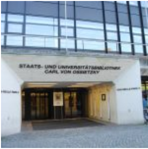
Staats- und Universitätsbibliothek Hamburg, familiérně Stabi