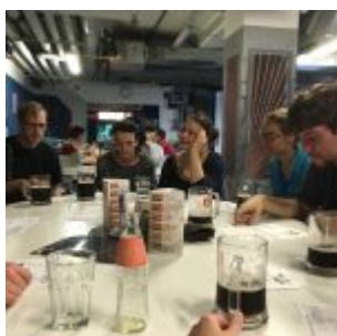
Pauza na dočerpání sil a vymýšlení taktiky pro týmový souboj